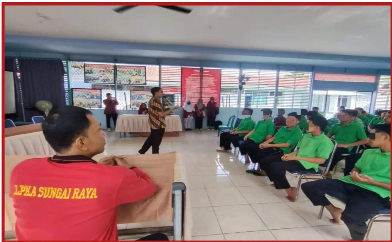
Gambar 2. Penyampaian materi

Promosi kesehatan mental akan dilaksanakan pada hari Selasa tanggal 24 Juli 2024. Materi yang disampaikan adalah melatih konsep diri yang baik bagi anak binaan. Kegiatan ini bertujuan untuk memberikan pemahaman diri anak binaan untuk mengenal diri mereka sendiri dan menetapkan target serta tujuan hidup. Aktivitas ini mendorong anak binaan mencari tahu siapa diri mereka, mengarahkan individu untuk menerima diri dan mengembangkan diri ke arah yang lebih baik dari sebelumnya.