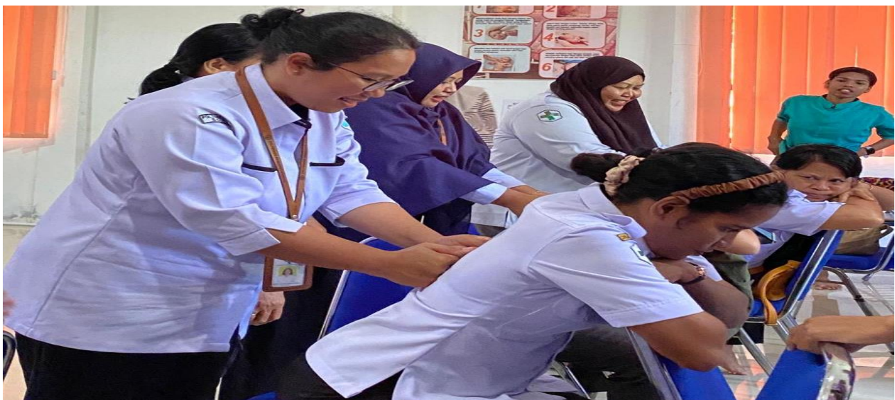
Gambar 4. Tim Pengabdi mendampingi peserta melakukan Teknik Endorphine Massage dan Pijat Oksitosin

Gambar 4 menunjukkan narasumber (Tim Pengabdi) bersama-sama dengan peserta melakukan teknik endorphine massage dan pijat oksitosin. Pada tahap ini tim pengabdi bertindak sebagai fasilitator yang memantau dan mendampingi para peserta melakukan teknik endorphine massage dan pijat oksitosin ke peserta lainnya. Para pengabdi memberikan arahan dan mempraktikkan teknik yang benar kemudian memberi kesempatan kepada peserta untuk melakukannya kembali.