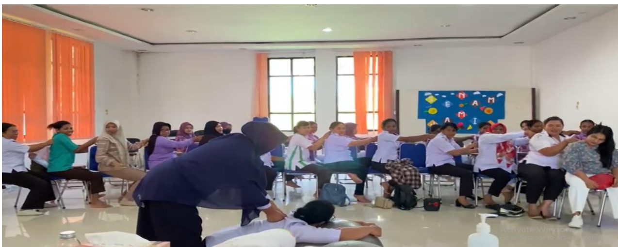
Gambar 3. Demonstrasi Langsung Teknik Endorphine Massage dan Pijat Oksitosin.

Gambar 1 menunjukkan kegiatan penyampaian materi terapi endorphine massage dan pijat oksitosin oleh ketua dan anggota tim pengabdian selaku narasumber. Kegiatan ini berlangsung selama kurang lebih 30 menit terdiri dari penyampaian materi dengan presentasi power point dan pemutaran video teknik endorphine massage dan pijat oksitosin. Selain itu tim pengabdian juga memberikan leaflet sebagai media edukasi tambahan. Edukasi yang diberikan antara lain: proses persalinan dan proses serta penyebab terjadinya nyeri dalam persalinan. Setelah penyampaian materi dilanjutkan dengan pemutaran video untuk meningkatkan pengetahuan bidan dalam menerapkan endorphine massage dan pijat oksitosin.