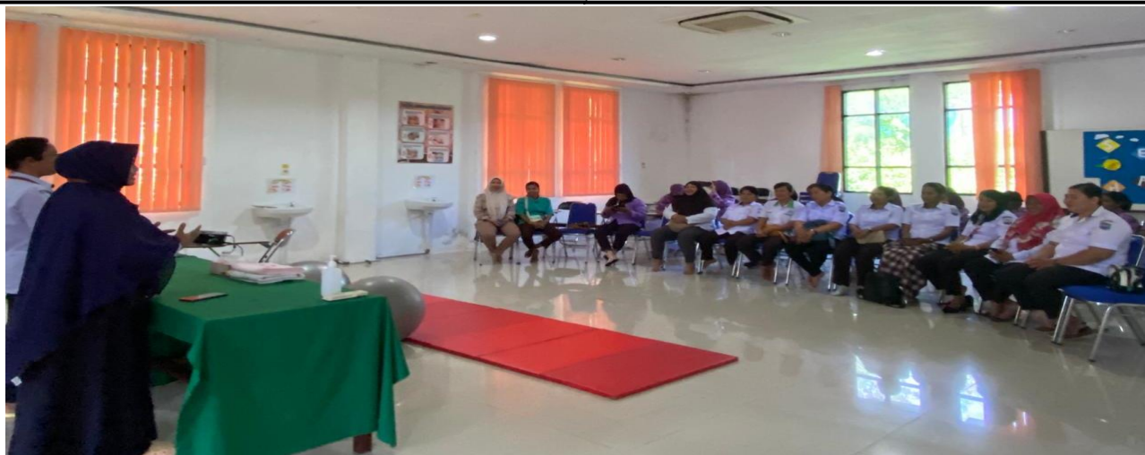
Gambar 6. Diskusi dan refleksi bersama

Gambar 6 menunjukkan bahwa setelah semua peserta dinilai mampu melakukan teknik endorphine massage dan pijat oksitosin selanjutnya dilakukan diskusi bersama dan refleksi untuk persamaan persepsi. Dalam tahapan ini juga para peserta menyatakan komitmennya untuk menerapkan teknik endorphine massage dan pijat oksitosin yang telah didapatkan dalam memberikan asuhan pada persalinan.