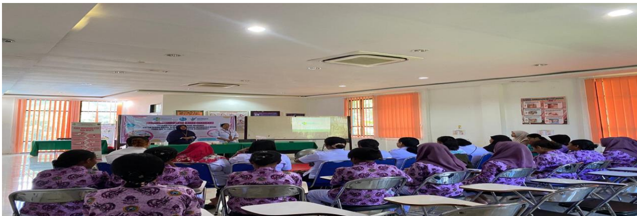
Gambar 2. Penyampaian materi terapi endorphine massage dan pijat oksitosin.

Pelatihan dan edukasi terapi endorphine massage dan pijat oksitosin ini melibatkan 25 orang bidan dari satu Rumah Sakit, empat Puskesmas dan satu Klinik Bersalin. Kegiatan ini dilaksanakan pada hari Sabtu, 09 Maret 2024 pukul 14.00 WIT. Ketua tim pengabdian beserta anggota bertindak sebagai narasumber yang memberikan edukasi serta pelatihan tentang teknik endorphine massage dan pijat oksitosin bagi bidan untuk meringankan intensitas nyeri pada ibu bersalin. Kegiatan lebih rinci dapat dilihat pada penjelasan dibawah :