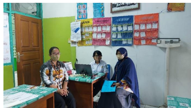
Gambar 1. Koordinasi dengan Kepala Puskesmas dan Bidan