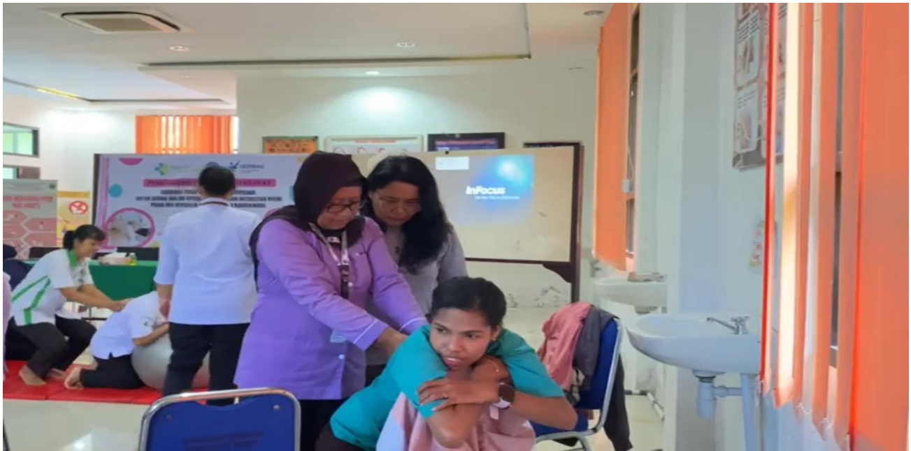
Gambar 5. Peserta melakukan Teknik Endorphine Massage dan Pijat Oksitosin secara mandiri

Gambar 5 menunjukkan peserta melakukan mempraktikkan sendiri teknik endorphine massage dan pijat oksitosin secara bergantian. Pada tahap ini sebagian besar peserta sudah mampu menerapkan endorphine massage dan pijat oksitosin secara mandiri.