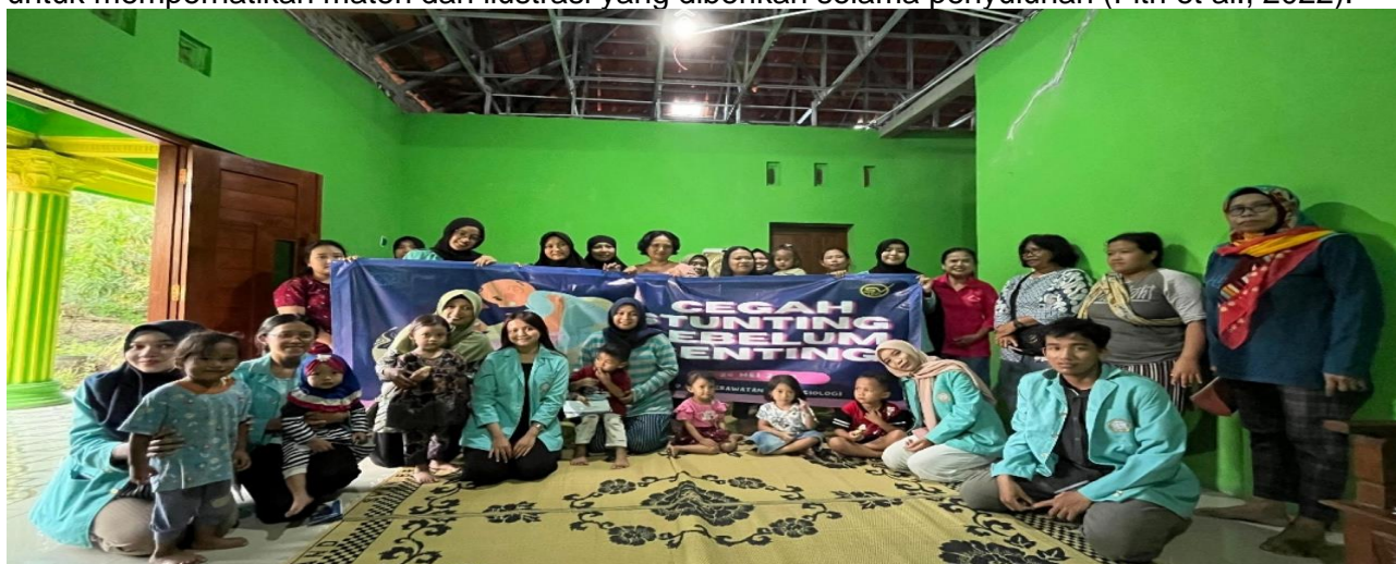
Gambar 1. Foto bersama Peserta

Hasil pengabdian masyarakat ini sesuai dengan penelitian Wijayanti & Issroviatiningrum (2022) yang menyimpulkan bahwa pendidikan kesehatan tentang pencegahan stunting dapat meningkatkan pengetahuan dan sikap ibu menggunakan evaluasi pre dan posttest . Inovasi dalam edukasi dapat meningkatkan potensi tercapainya peningkatan pengetahuan ibu, salah satunya menggunakan leaflet . Leaflet yang diberikan diharapkan dapat meningkatkan antusiasme peserta untuk memperhatikan materi dan ilustrasi yang diberikan selama penyuluhan (Fitri et al., 2022).