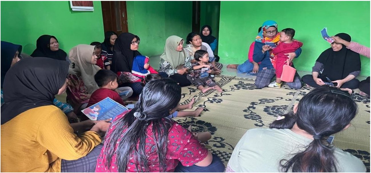
Gambar 2. Proses Penyuluhan Pencegahan Stunting