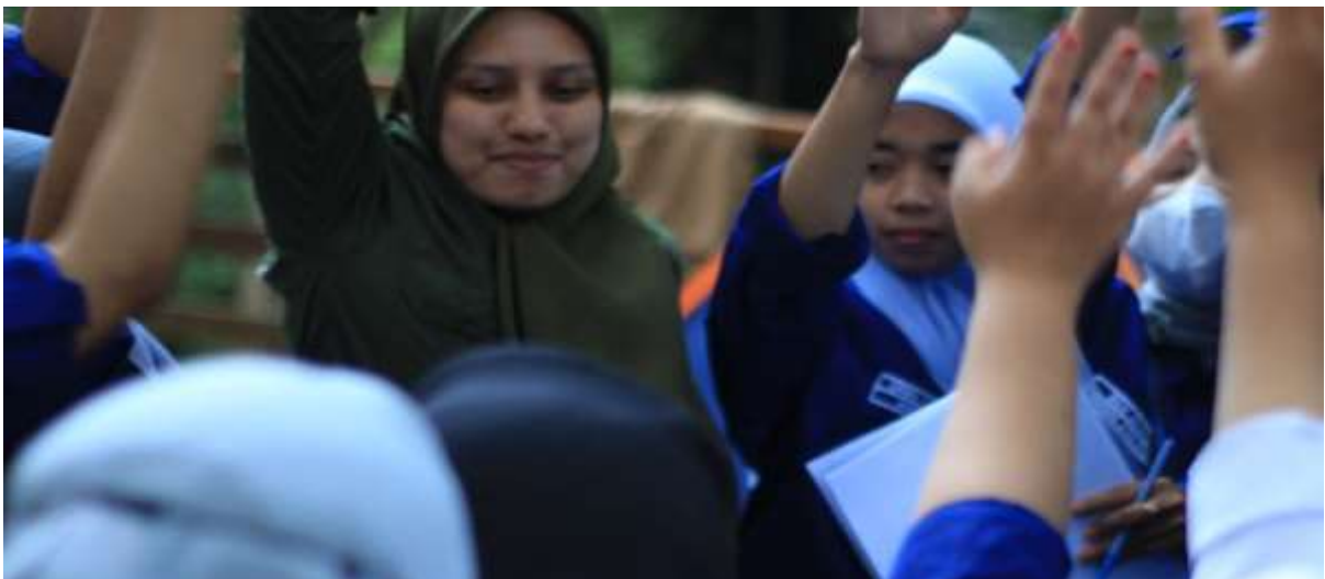
Gambar 2. Pembentukan panitia inti untuk penyusunan proposal pencarian sponsor