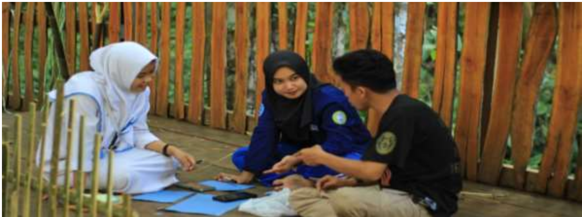
Gambar 1. Diskusi survey lokasi kegiatan