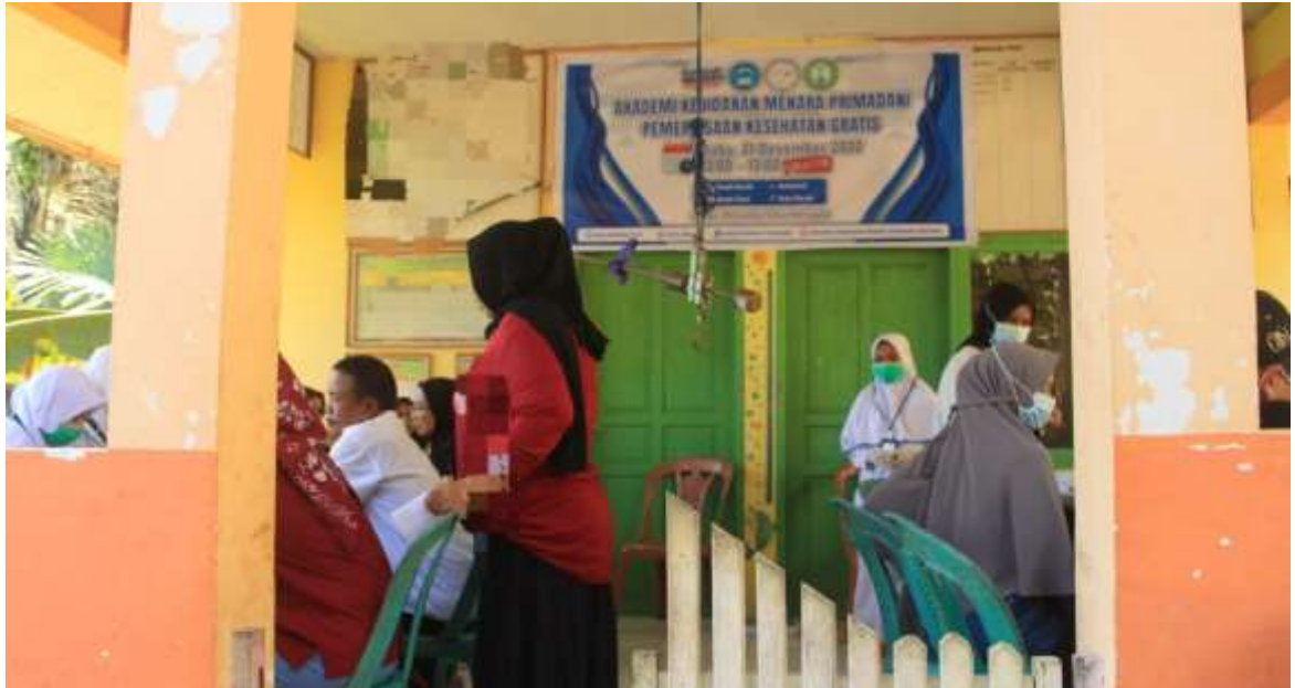
Gambar 6. Pemeriksaan Kesehatan.