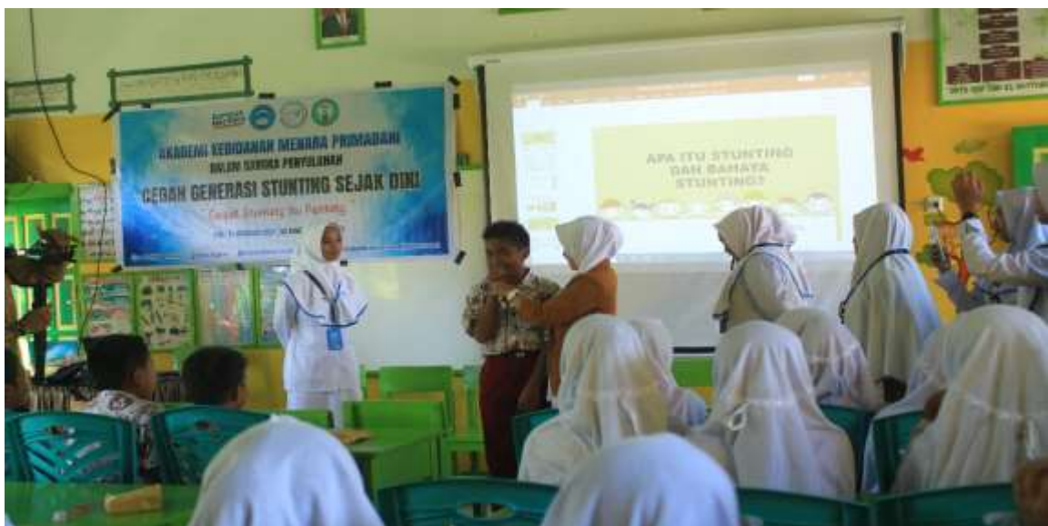
Gambar 5. Penyuluhan Kesehatan