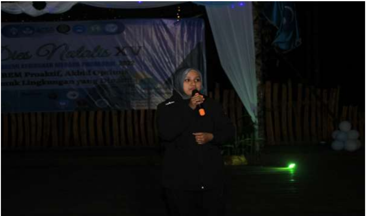
Gambar 6. Sambutan wakil direktur III bidang kemahasiswaan, alumni dan kerjasama pada malam seremonial diesnatalis.