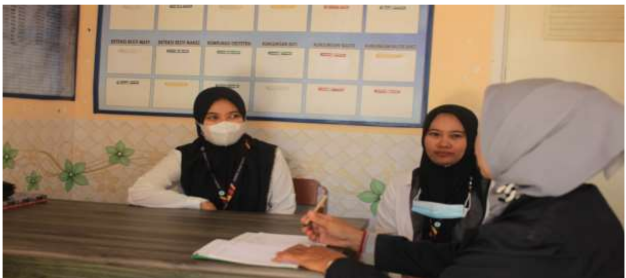
Gambar 3. Diskusi dengan Mitra.