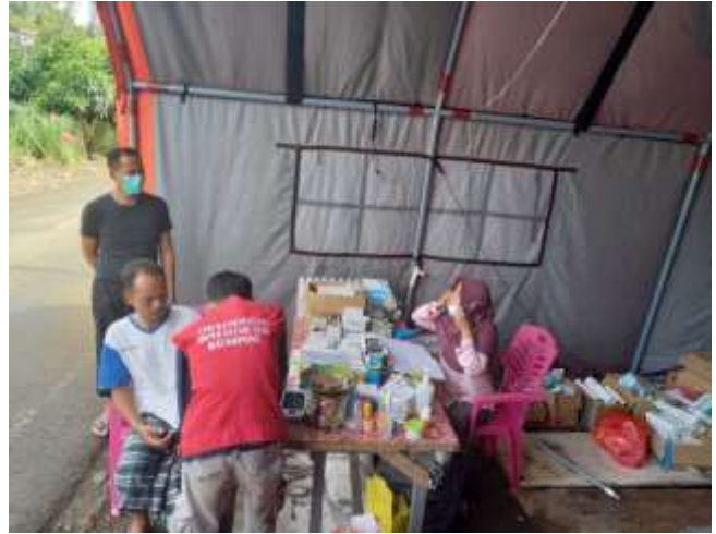
Gambar 5. Pemeriksaan kesehatan di Posko Pengungsian dan Pemeriksaan di Posko Induk Desa Tappalang