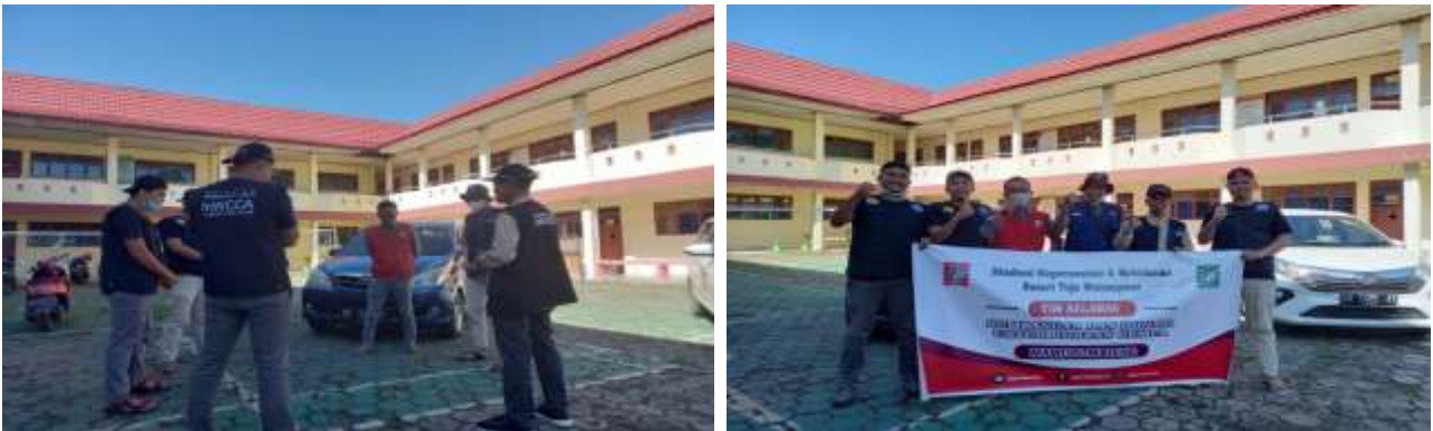
Gambar 1. Persiapan Keberangkatan

Tim Berangkat sekitar Pukul 10.00 WITA menggunakan kendaraan mini bus melalui jalur darat dengan melalui beberapa kabupaten seperti kabupaten sidrap, kabupaten Pinrang sampai kepada jalur poros Kabupaten Majene sebelum sampai ke Posko Desa Tappalang.