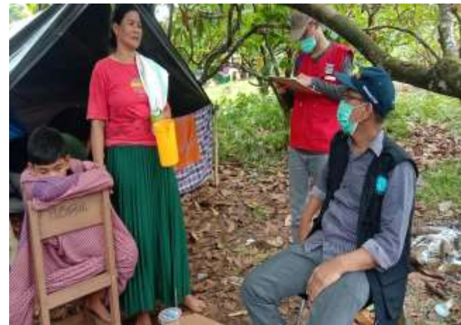
Gambar 6. Perjalanan Menuju Posko Pengungsian dan Wawancara dengan salah satu Korban yang berada di Posko Pengungsian Desa Kopeang.

Dari 5 Posko Pengungsian yang dikunjungi selama berada di Lokasi Gempa yaitu Posko Pengungsian Desa Bela, Desa Takandaeng, Desa Kopeang, Desa Tappalang dan Desa Ta'an 35 Korban luka-luka yang ditemukan di Posko Pengungsian segera dilakukan perawatan Luka Modern.