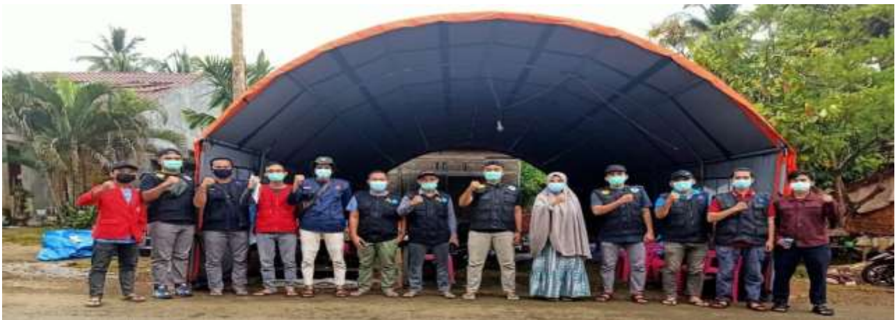
Gambar 2. Hari Pertama tiba di Posko Lokasi Gempa Desa Tappalang bersama Kepala Puskesmas Tappalang, Tim Ikram Bauk Wound Care dan Dosen Akper Batari Toja.