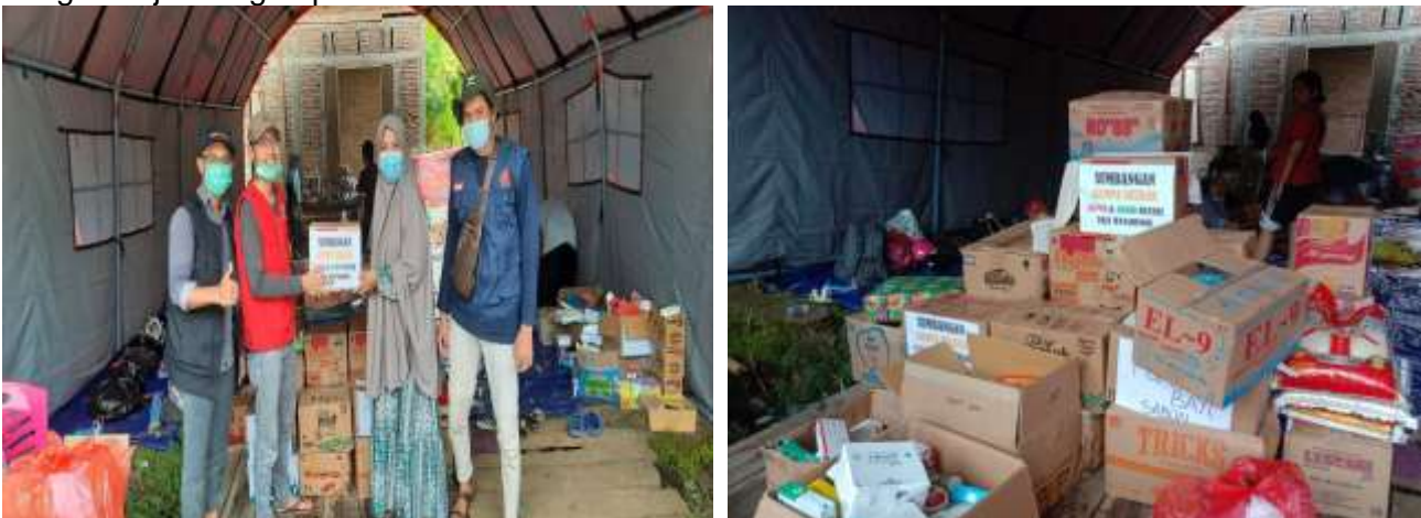
Gambar 4. Serah Terima Donasi Logistik dengan Kepala Puskesmas Tappalang Kabupaten Mamuju

Pada hari pertama tiba di lokasi tim segera lakukan pemberian donasi kepada masyarakat yang diwakili oleh Kepala Puskesmas Tappalang yang juga menjadi Penanggung jawab Posko di Kecamatan Tappalang yang nantinya akan di distribusikan untuk korban Gempa. Setelah itu, Tim Langsung melayani Korban yang datang di Posko dengan melakukan pemeriksaan kesehatan dan pemberian obat yang tersedia di Posko Induk. Setelah itu, Tim melakukan kunjungan dengan berjalan kaki di Posko-posko pengungsian yang berada di sekitar Posko Tappalang sebanyak 13 KK di temukan meninggalkan rumah mereka karena dalam keadaan rusak dan masih trauma dengan kejadian gempa.