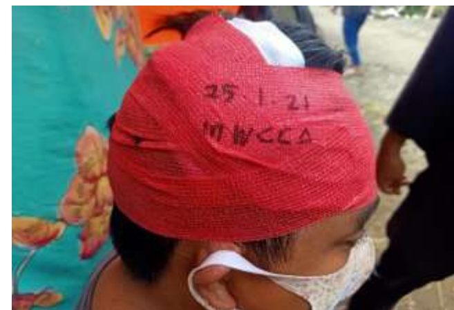
Gambar 7. Salah satu Korban Gempa yang diberikan perawatan Luka